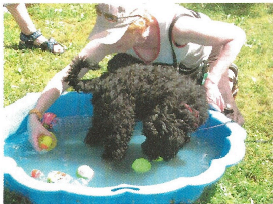
was soll ich den hier ausser Baden und Trinken?