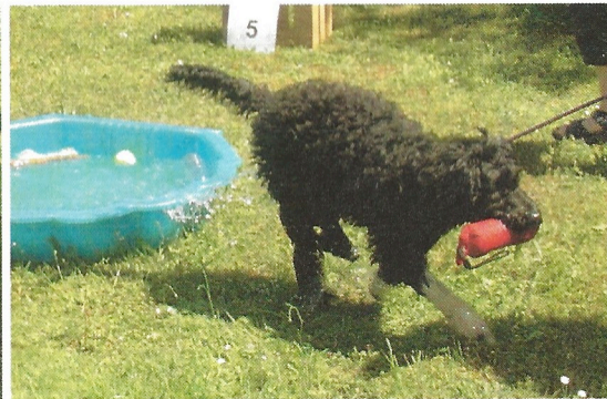
gelernt ist gelernt!