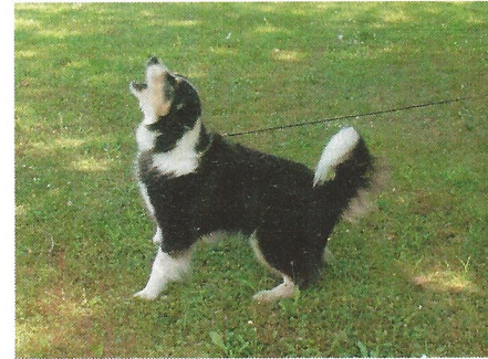
Na los, da bin ich doch!!!