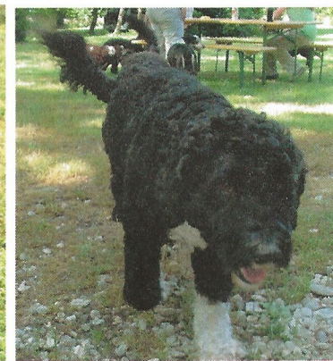
ich brauche jetzt erstmals eine Pause!