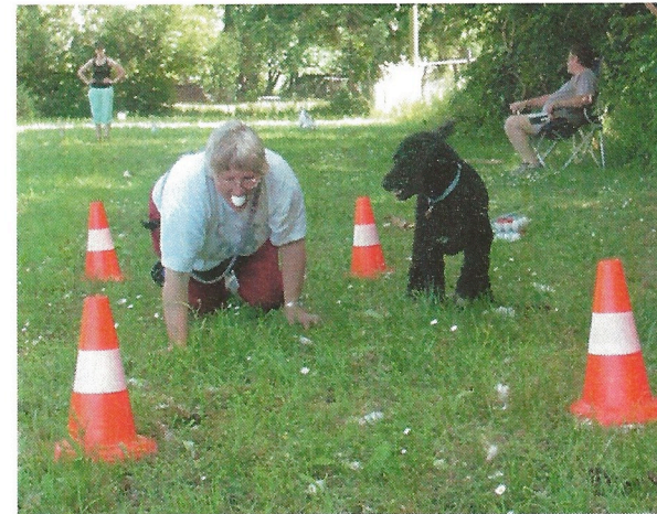
Das machst du super, Frauchen!