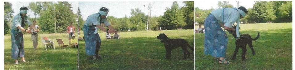
kalt, kalt, eiskalt -