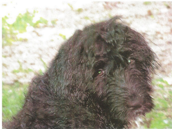
Auf Wiedersehen am Kipp Treff 2007!!!