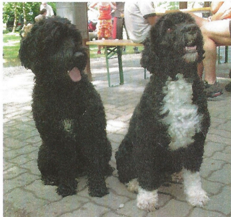
Sind wir nicht die schönsten?