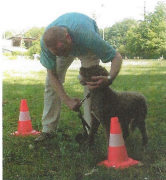
kein Problem für ein Routinier