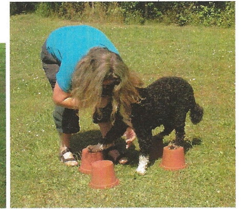
Eine knifflige Sache, mit diesen Blumentöpfen...