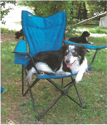
die wohlverdiente Ruhepause...